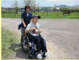
ホーム外出時の様子