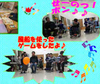
船を使ったゲームをしたよ!