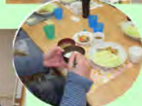
管理栄養士のたてた献立 手作りです!

ケアステーションあいでは今年一月より、増築を行い、新しく短期棟が完成しました。現在六床での短期入所サービスを実施しています。利用者様はもちろん、ご家族様も安心して利用して頂けるよう支援していきます。