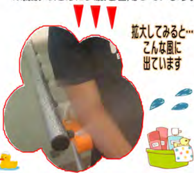
拡大してみると... こんな風に出ています