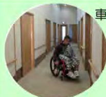
車いすもスイスイ!