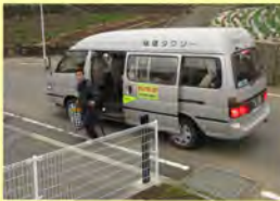
社会資源を利用して仕事へ通います。